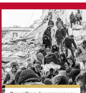
Des milliers de personnes se sont retrouvées sans abri, alors que le froid sévit dans la région.