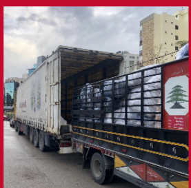
5 216 couvertures ont été distribuées à Alep.